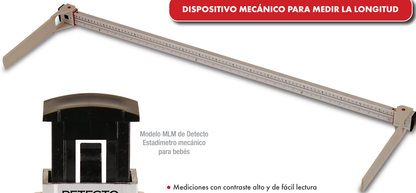
Modelo MLM de Detecto Estadímetro mecánico para bebés

DISPOSITIVO MECÁNICO PARA MEDIR LA LONGITUD